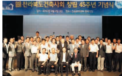
전북건축사회 창립 45주년 기념식