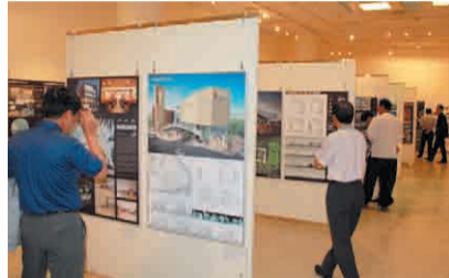
많은 사람들의 주목을 받은 국제교류 전시회