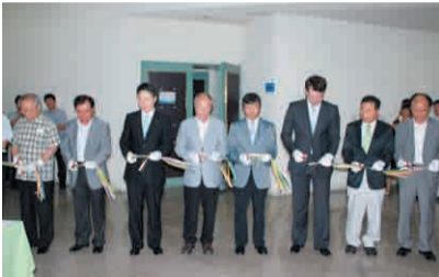
'건축문화축제' 개막을 알리는 테이프 커팅식